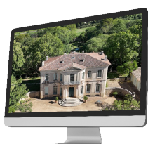
Le château de l'Engarran (Occitanie)