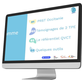
Le référentiel sur la QVCT en bref par le PRST Occitanie