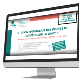
Des repères partagés par le PRST Aura