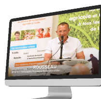
Entreprises du régime agricole (Occitanie)