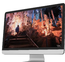
L'Aven Armand et la cité des Pierres (Occitanie)